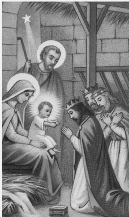
L'ADORAZIONE DEI RE MAGI

O Dio vivo e vero, che hai svelato l'incarnazione del tuo Verbo con l'apparizione di una stella e hai condotto i Magi ad adorarlo e a portargli generosi doni, fa' che la stella della giustizia non tramonti nel cielo delle nostre anime. Donaci, o Padre, l'esperienza viva del Signore Gesù che si è rivelato alla silenziosa meditazione dei Magi e all'adorazione di tutte le genti; e fa' che tutti gli uomini trovino verità e salvezza nell'incontro illuminante con lui, nostro Signore e nostro Dio. Amen.